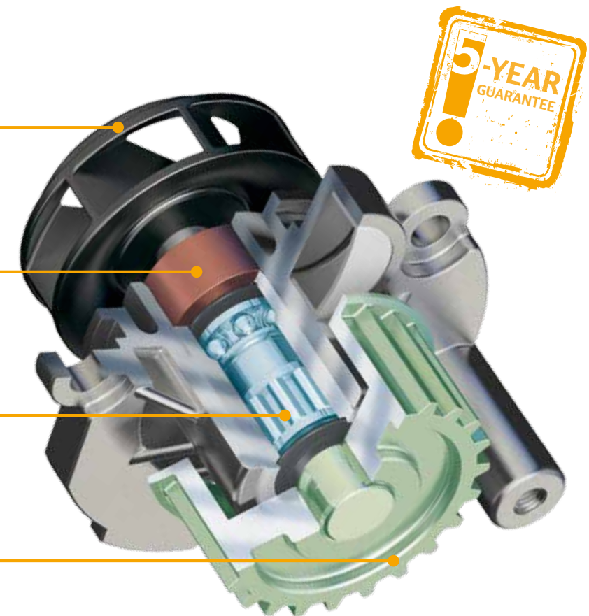
Hassas biçimlendirilmiş diş profilili dişli kasnak